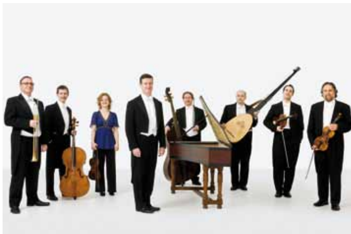
The English Concert

DI | 07.08. | 20:00 UHR | KIRCHE SENGWARDEN HAUPTSTRASSE, 26388 WILHELMSHAVEN EINTRITT: 25,00 € | 20,00 € | 15,00 € | ARR.: +5,00 €