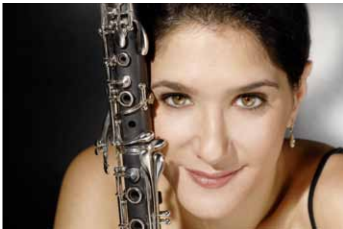
Sharon Kam

SO | 01.07. | 17:00 UHR | KIRCHE REEPSHOLT KARKWEG, 26446 FRIEDBURG-REEPSHOLT EINTRITT: 25,00 € | 20,00 € | 15,00 € | ARR.: +5,00 €