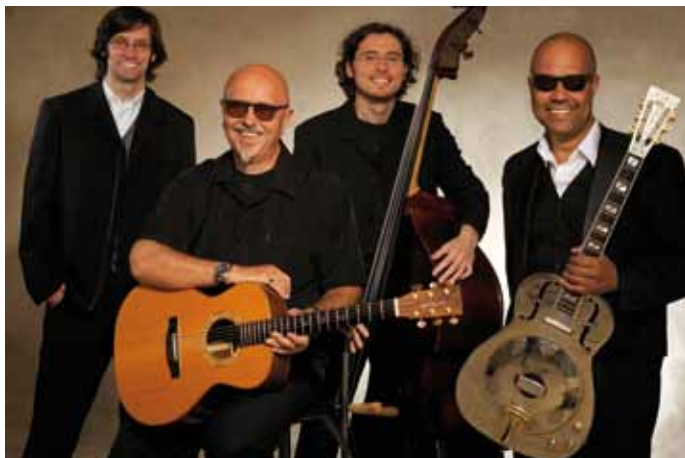
Blues Company

FR | 06.07. | 20:00 UHR | KIRCHE MÜNKEBOE UPENDER STRASSE 26624 SÜDBROOKMERLAND-MÜNKEBOE EINTRITT: 20,00 € | 15,00 € | ARR.: +5,00 €