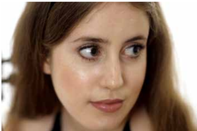
Vilde Frang

DO | 21.06. | 20:00 UHR | LAMBERTIKIRCHE KIRCHSTRASSE 10, 26603 AURICH EINTRITT: 25,00 € | 20,00 € | 15,00 € | ARR.: +10,00 €