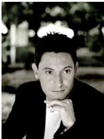
Maurice Steger | Foto: KASSKARA

On tour with the renowned baroque orchestra „The English Concert“ in 2008 the famous flautist Maurice Steger enchanted members of the listeners all over Europe and thus restored the honour of the flute. The acoustic in the charming church of Sengwarden is especially suitable to ancient music.