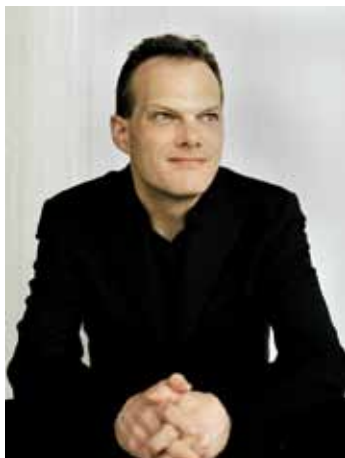
Lars Vogt

Both Sharon Kam and Lars Vogt are renowned musicians enjoying playing chamber music together whenever they get the chance to do so. Sharon has been honoured twice with the Echo Klassik and Lars has been among the first pianists who were artist in residence at the Berliner Philharmoniker.