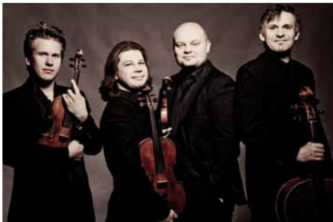
Szymanowski Quartett

MO | 27.08. | 20:00 UHR | GROSSE KIRCHE LEER REFORMIERTER KIRCHGANG 17, 26789 LEER EINTRITT: 25,00 € | 20,00 € | 15,00 € | ARR.: +10,00 €