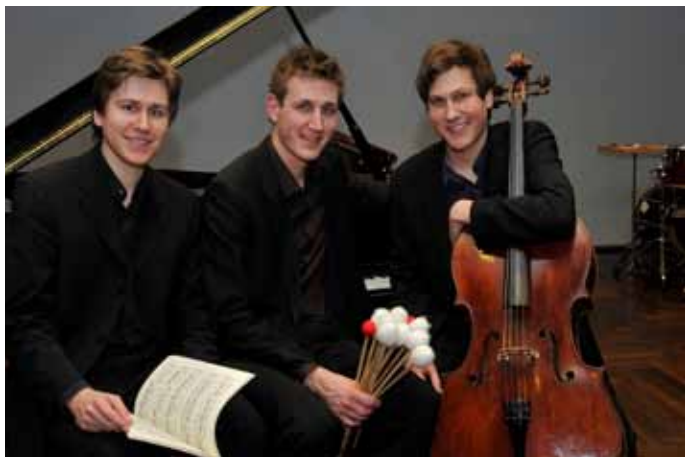
Brüder Gerassimez

MI | 25.07. | 20:00 UHR | ALTES KURHAUS DANGAST AN DER RENNWEIDE 46, 26316 VAREL-DANGAST EINTRITT: 18,00 € | 13,00 € | ARR.: +10,00 €