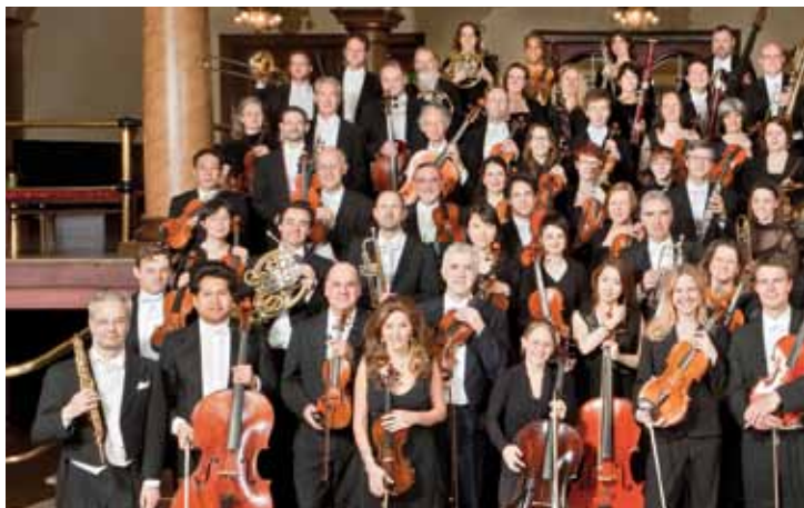
Philharmonisches Orchester Heidelberg

FR | 07.09. | 20:00 UHR | JOHANNES A LASCO BIBLIOTHEK KIRCHSTRASSE, 26721 EMDEN