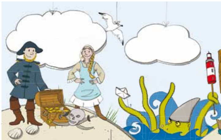
Illustration: Ina Clement/spökfabrik

SO | 22.07. | 11:00 - 16:00 UHR | LANDWIRTSCHAFTS- MUSEUM CAMPEN | KRUMMHÖRNER LANDSTRASSE 26736 KRUMMHÖRN-CAMPEN EINTRITT: 10,00 € TAGESKARTE | 5,00 € JE MUSICAL