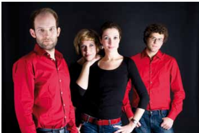
Amaryllis Quartett | Foto: © Tobias Wirth

MO | 23.07. | 20:00 UHR | KIRCHE PEWSUM DROSTENPLATZ 6, 26736 KRUMMHÖRN-PEWSUM EINTRITT: 18,00 € | 13,00 € | ARR.: +8,00 €