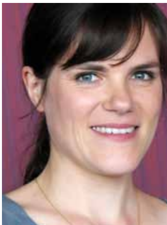
Fritzi Haberlandt

The German actor Fritzi Haberlandt tells the story about Constanze and her husband the composer Wolfgang Amadeus Mozart, their life with all heights and depths. The famous musicians are accompanying her with special matching works.